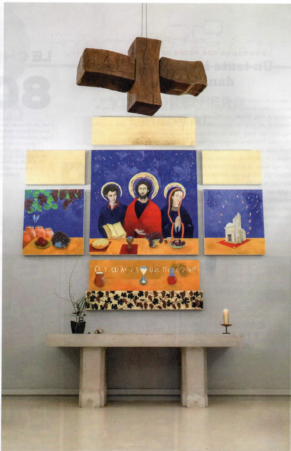
⇒ Église Saint-Rémi- de-la-Vigne, à Bacalan, quartier du nord de Bordeaux. Le polyptyque de Frank Denon représente les noces de Cana, où Jésus transforme l'eau en vin. Au- dessus, la croix en bronze de l'artiste Zigor, abritant les hosties, peut être descendue le long d'un câble à l'aide d'une télécommande